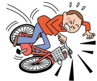
自転車で転倒してケガ