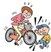
自転車で他人にケガを負わせた