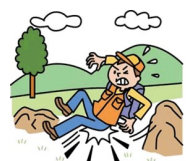
ハイキング中にケガ