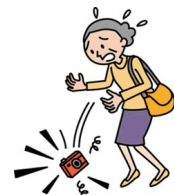
カメラを落として壊した