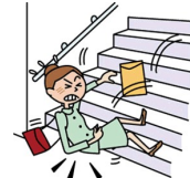
足を滑らせてケガ